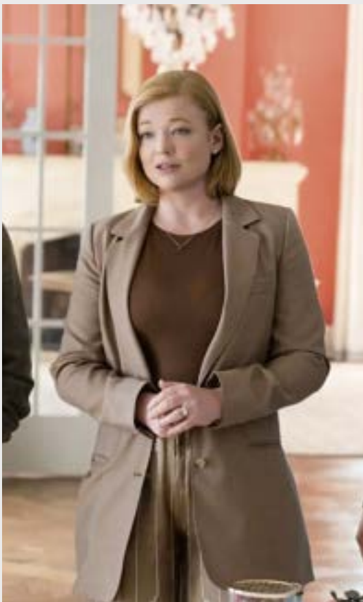
SUCCESSION - MAX